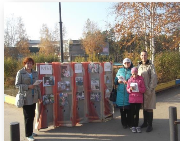
Акции «Примите ребёнка в семью!»