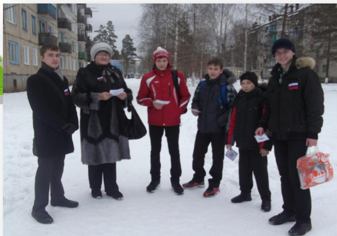
Участие в акции «Я гражданин-России»