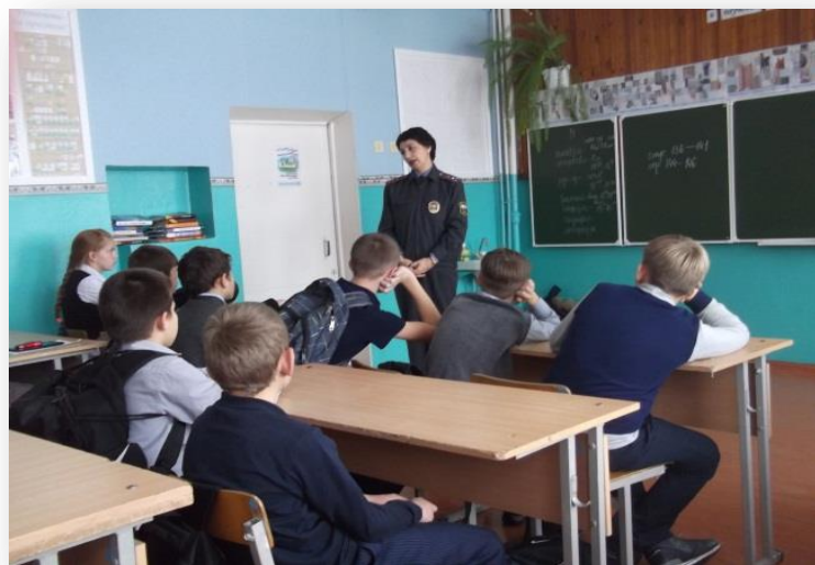
Участие в занятиях по профилактике ПАВ